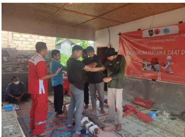
Gambar 1. Pelatihan Simulasi Evakuasi Korban Bencana

Tahap terakhir yang dicapai dalam pelatihan peningkatan kapasitas adalah tujuan psikomotorik. Fasilitator mencapai tujuan psikomotorik dengan terlebih dahulu mencapai tujuan kognitif, dan tujuan afektif. Tujuan yang ingin dicapai fasilitator dalam ranah psikomotorik peserta pelatihan adalah kemampuan bertindak atau keterampilan ( skill ), sesuai dengan prosedur-prosedur kebencanaan yang telah disampaikan oleh fasilitator. Metode praktek lapangan digunakan dalam mencapai tujuan psikomotorik peserta, dimana fasilitator memberikan beberapa permainan simulasi bencana (lihat gambar 1).