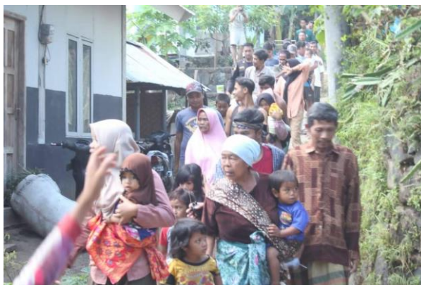
Gambar 2. Simulasi Uji Coba Jalur Evakuasi

Pasca resmi terbentuk dan mengikuti pelatihan peningkatan kapasitas, selanjutnya TSBD bertugas mengimplementasikan pengetahuan yang telah di dapat dengan mengadakan kegiatan PRB di tingkat Desa. Kegiatan PRB atau lebih dikenal sebagai RAM tersebut disusun dengan mempertimbangkan hasil kajian risiko desa, sehingga kegiatan PRB terhadap ancaman gempa bumi diharapkan dapat dilaksanakan dengan efektif dan efisien. Tim Siaga Bencana Desa menyoroti dua hal yang menjadi pokok perhatian dalam melakukan PRB gempa yaitu aspek sosial dan fisik. Ranah sosial fokus pada peningkatan pengetahuan bencana masyarakat Desa, sedangkan ranah fisik terkait dengan rekonstruksi bangunan pemukiman seperti Rumah Tahan Gempa (RTG) yang sedang dilakukan oleh Pemerintah dan rekonstruksi fasilitas umum seperti penyediaan plang jalur evakuasi, titik kumpul, serta Pusat Evakuasi Masyarakat (PEM). Terkait aspek sosial dan fisik dalam kegiatan upaya PRB gempa, Tim Siaga Bencana Desa bergerak ke setiap Dusun untuk mengedukasi masyarakat terkait pengetahuan dalam penyelamatan diri dan orang lain hingga melakukan evakuasi, mengenalkan konstruksi rumah tahan gempa yaitu rumah instan kayu, dan mengenalkan titik kumpul terdekat serta jalur-jalurnya sampai menuju PEM. Tim Siaga Bencana Desa bersama tim pengelola PEM juga mengadakan simulasi bencana bersama masyarakat, dan menguji coba jalur evakuasi beserta titik kumpulnya di setiap Dusun secara rutin (lihat gambar 2).