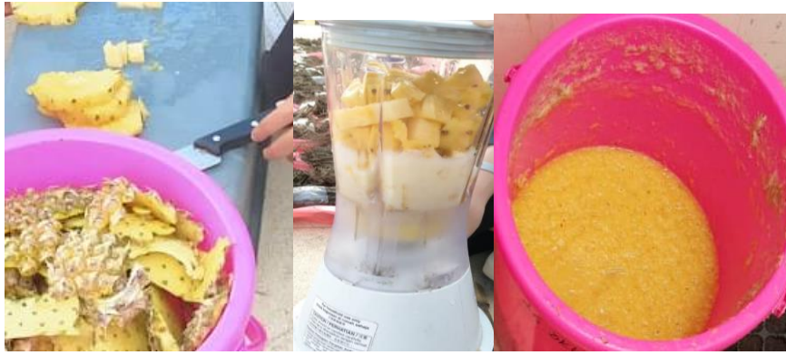
Gambar 1. Proses pembuatan MOL buah nenas