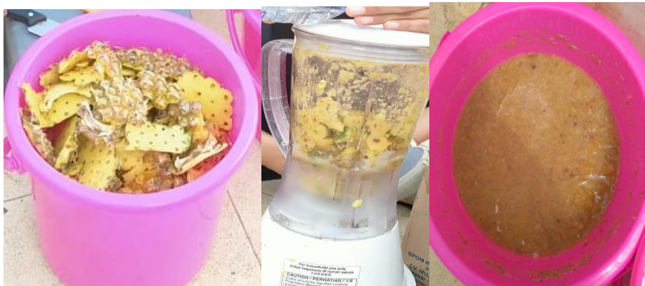
Gambar 2. Proses pembuatan MOL kulit nenas